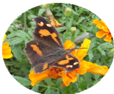
テングチョウ (2007年7月)