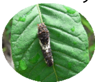
今年6/13に植えたキハダ にきたアゲハの幼虫