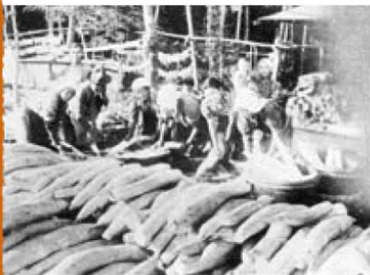
かつての春日町 大根洗いをしているところ

分類のしかたには、いろいろな切り口があり、その方法を検討しています。インデックスで年代ごとにまとめ、分かりやすい 資料 にしたいと思っています。