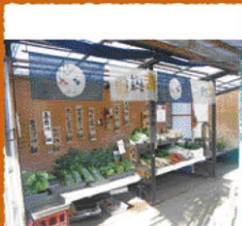
環八沿いに残る野菜の直売所