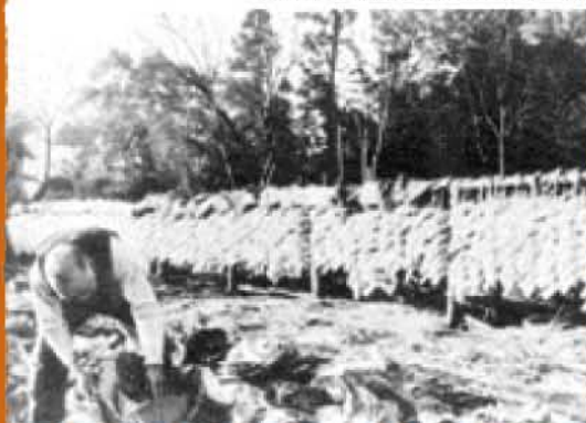
大根干しとキャベツの収穫 今ではこの光景も貴重になってきた

練馬春日町駅周辺街づくりの会 は、環状8号線や新駅の開設、駅前再開発などさまざまなまちの変化に対し、まちづくりの推進のために活動をしてきました。 その中で変わっていったまちの歴史を残し、次の世代に伝えていきたいという思いが強くなり、便利になったもの、失ったものなどまちの変遷を知る方から聞き取り調査を行い資料編としてまとめる活動を行っています。