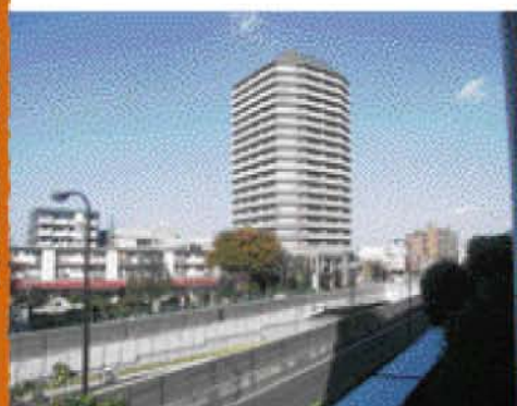
練馬区最初の再開発ビル「エリム春日町」は平成8年に竣工した