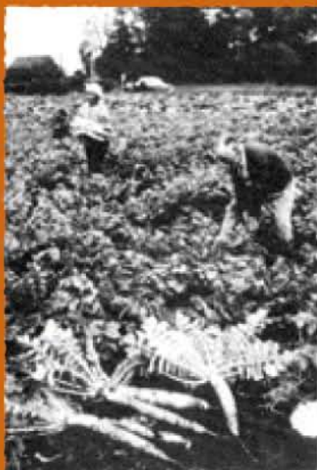
かつての春日町 大根の収穫を しているところ

練馬春日町駅周辺街づくりの会 は、環状8号線や新駅の開設、駅前再開発などさまざまなまちの変化に対し、まちづくりの推進のために活動をしてきました。 その中で変わっていったまちの歴史を残し、次の世代に伝えていきたいという思いが強くなり、便利になったもの、失ったものなどまちの変遷を知る方から聞き取り調査を行い資料編としてまとめる活動を行っています。