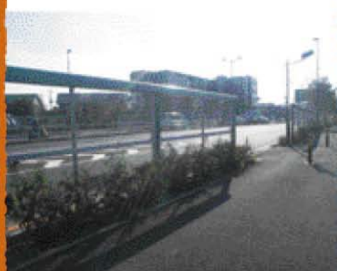
会の働きかけにより、設置された透明の防音壁

そのように地域にあった風景はいつの間にか変わり、失われていったモノが多くあることを実感する調査となりました。会としては、この調査を通じて浮かび上がってきた課題について、これからのまちのあり方を考えながら次の活動につなげていこうと話しているそうです。