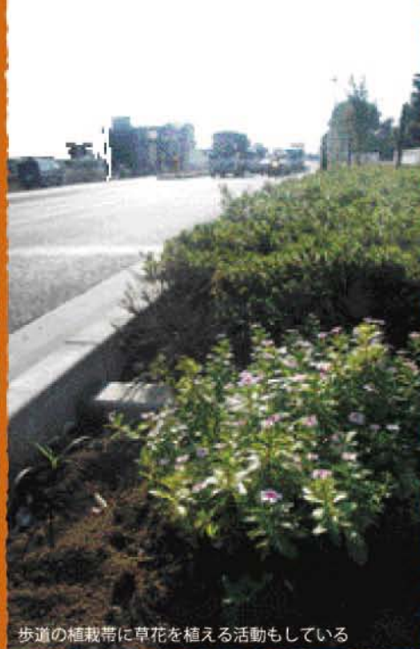
歩道の植栽帯に草花を植える活動もしている