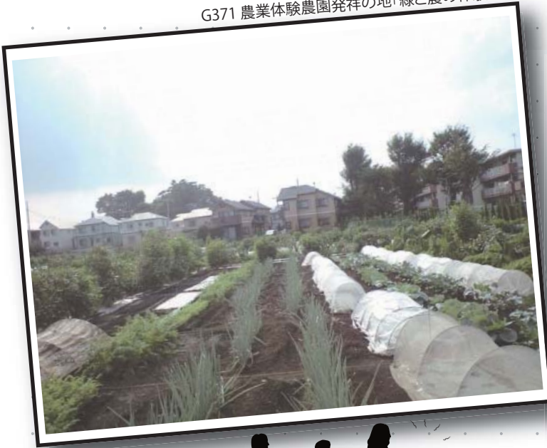
G371 農業体験農園発祥の地「緑と農の体験塾」