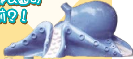
豊玉公園のタコのすべり台