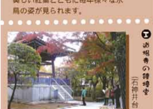
道場寺境内にある鐘撞堂です。周囲の木立との調和も絵になります。(石神井台)