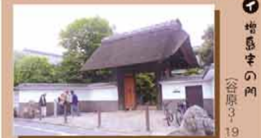
かやぶきの四脚門は風格のある薬師門です。(谷原3-19)