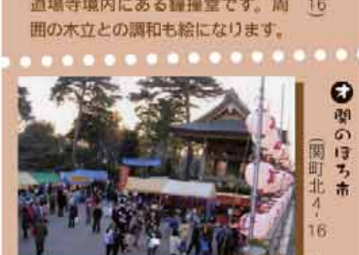
冬の風物詩の一つで、毎年12月9日・10日に行われます。(関町北)