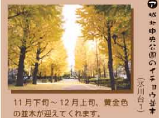
11月下旬~12月上旬、黄金色の並木が迎えてくれます。(永川台)