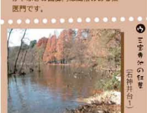
美しい紅葉とともに毎年様々な水鳥の姿が見られます。(石神井台)