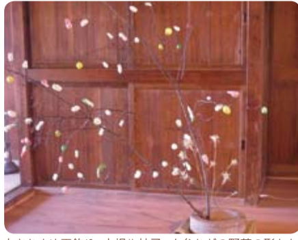
大きなまゆ玉飾り、大根や柚子、人参などの野菜の形も！

1月14日には、石神井ふるさと文化館の古民家で、年明け行事として行われてきた、まゆ玉飾りを作りました。上新粉を練って団子状にしたものを、ソロやケヤキの枝にさし、今年の豊作を願ったものです。始まりは、養蚕をしている農家が、まゆが沢山出来ることを願って作ったものです。練馬では、養蚕と合わせ野菜もたくさん作っていたので、様々な形を作って飾ることもあったようです。