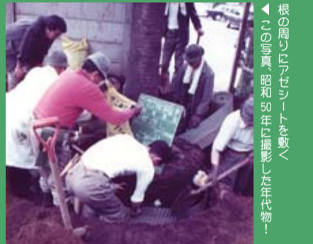
根の周りにアゼシートを敷く この写真、昭和50年に撮影した年次物!

根回し期間が短いこともあり、林業試験場(浅川実験林)の場長であった植村博士の林試A法という方法による移植を実施した。アゼシートとパーク堆肥を活用した移植法である。春先に根の環状剥皮をし、アゼシートとパーク堆肥による保護を施し、βインドール酪酸・9-ベンジルアデニンを環状剥皮した部分に塗布した。夏を越し確認すると見事な細根が発根していた。移植は成功した。