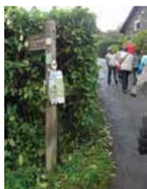
フットパスの案内標識

日本の「公共空間」は誰が管理し、誰のための場所でしょうか?日本では「official/公の・行政の」、イギリスでは「common/共有の・共同の」という意識が強いように感じます。ルールを守って空間を堪能し、だからこそ管理活動にも参加する等、市民一人一人の意志と協力で運営することにより、後世に残る場になるのではないのでしょうか。練馬にも憩いの森等の素敵な「公共空間」があります。「区民共有の common スペース」として、そのあり方をみなさんで考えていきませんか。