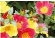
花粉を運んでくれるミツバチは、花にとって益虫です