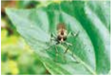
静かに獲物を狙うムシヒキアブの仲間

花壇のお手入れをするとき、小さな生きものを探すが私の楽しみのひとつです。花の蜜を吸いにやってくるチョウやハチの仲間、それを狙う肉食のアブ、葉っぱを食べるイモムシや、土から顔を出すミミズなど。まちの中の花壇は、私たちの目を楽しませてくれるだけではなく、生きものたちにとっても貴重な生活の場になっているようです。