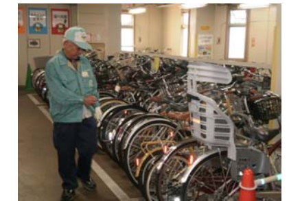
大泉学園駅南第二自転車駐輪場の様子

自転車は区民の方々の活動の中で主要な交通手段になっている、環境にやさしい乗り物です。そうした中でタウンサイクルや駐輪場などの効果的・効率的な活用を促し、また放置自転車をなくすための活動を地域の方々と連携して行うことで、安全で便利な自転車の利用環境と快適な駅周辺の市街地環境の整備改善につとめています。