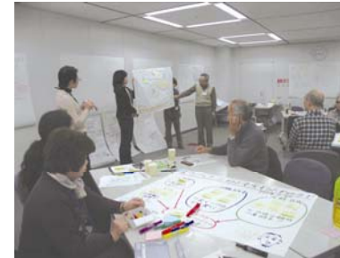
センター主催のワークショップの様子

まちづくりセンターは、練馬区民が住みたいと思えるような美しい地域環境と豊かな地域社会を実現するために、区民の主体的なまちづくり活動を支援するとともに、区民・事業者・行政から独立し連携を図る、中間的な立場から協働型まちづくり事業を実践します。