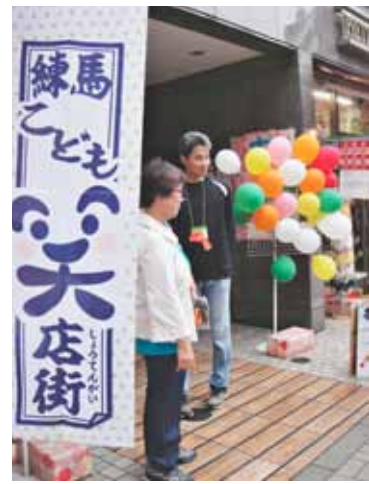
会場は洋服屋さんが貸して下さったマンションのピロティ。

光が丘体育館が、子ども達の歓声に包まれたまさに同じ日に、練馬駅の南口エリアでも、お仕事体験をしながらまちなかを遊ぶ『練馬こども笑店街』のボッチャ体験コーナーにたくさん子ども達が集まりました。意外に遠くまで転がってしまう球の扱い方を、ていねいに教わりながら、目標の白い球をめがけて上手になげました。