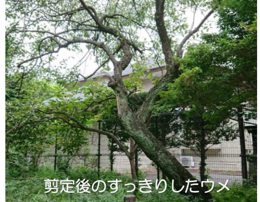
剪定後のすっきりしたウメ

ぜひ、秋らしさを感じさせてくれる花や鮮やかな実やドングリを探しに、足を運んでみてくださいね。