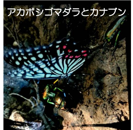
アカボシゴマダラとカナブン