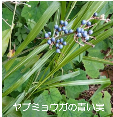
ヤブミョウガの青い実