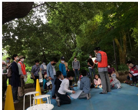
解説を聞いて散策に出発