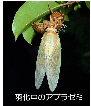
羽化中のアブラゼミ

普段見ることが出来ない都会の夜の森を体験できて、大人も子供も楽しいひと時を過ごしました。