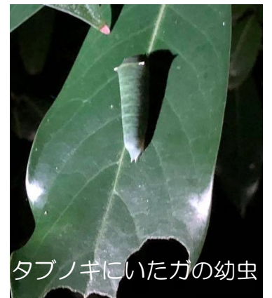
タブノキにいたガの幼虫