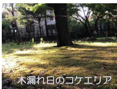
木漏れ日のコケエリア