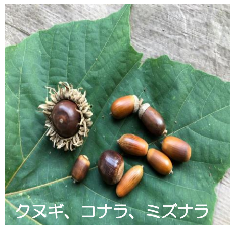
クヌギ、コナラ、ミズナラ