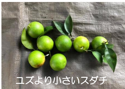
ユズより小さいスダチ