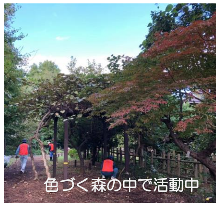
色づく森の中で活動中

ひっきりなしに落ちてくるドングリの音や、にぎやかに響き渡る鳥たちの鳴き声、踏みしめる落ち葉の音に季節を感じに来てくださいね。