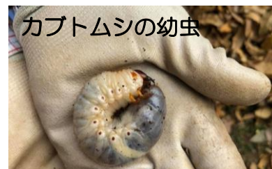
カブトムシの幼虫

さらにメンバーのアイデアで、活動で剪定したサルスベリの枝を使って、コケエリアの柵をつくりかえました。丁度いい長さに切ったものを、一つ一つ先を削り、防腐のためにバーナーで焼いたものを刺して、ロープを通して出来上がりです。手間をかけた分、ステキな柵ができました。新しい風景をぜひ見に来てくださいね♪