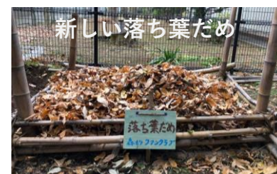
新しい落ち葉だめ