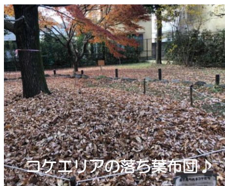
コケエリアの落ち葉布団♪