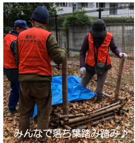
みんなで落ち葉踏み踏み♪