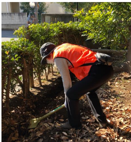
女性もしっかり掘ります！