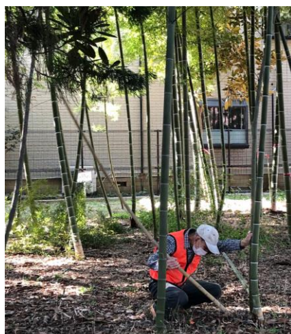
タケの間引きも大切です