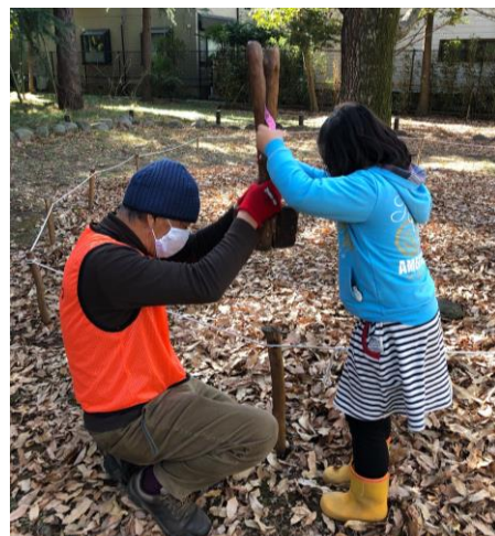
カいっぱい杭を打ち込み中