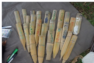
ねりっこクラブのみなさんと、草の名札(草名板)を作りました