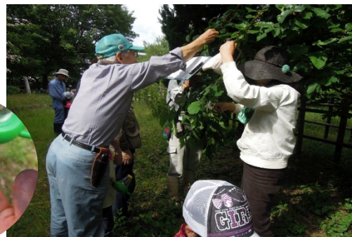
ヤマゲタが食べごろでした♪たくさん食べた手はムラサキ色！