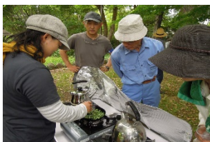
ササをいって、香りを引き出して・・・。手作りのお茶はおいしい！