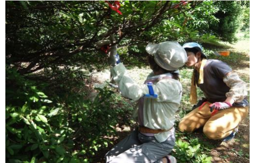
南側園路のスタヂやクロガネモチを剪定し、見通しをよくしました！

訪れる方にもっと安心して利用してもらおうと、入口からの見通しをよくすることを目的に樹木の剪定を行いました。生垣の刈り込みのほか、南側園路に飛び出している枝の剪定、入口そばにある実生木（植えたものではなく自然に生えたもの。樹林内を過密にします）の伐採をしました。