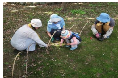
木陰の下でのコケのお手入れは心地よかったです！