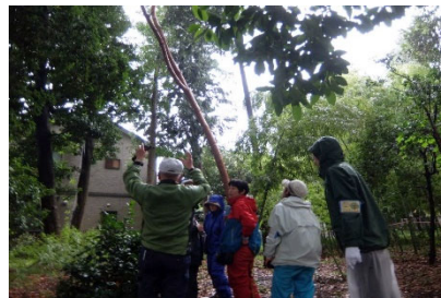
区に剪定をお願いしたい高木について検討しました。