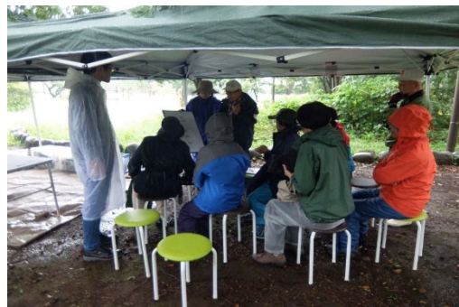
テントの中で身を寄せあって話し合いです！！

今年度は「子どもたちの参加を増やしたい」という思いから、近隣のねりっこクラブ（学童クラブ）への声かけやイベントチラシ配布をしてきました。今ではねりっこクラブの参加はお馴染みになっています。また、天候によって、目標の活動ができない月もあったことから、予備日や活動日以外の活動の必要性について話し合いました。来月から早速予備日を設けて活動します。