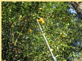
【ユズ・スタチの収穫】

秋は、次の春に向けてのお手入れを始める時期。やらねばならないお手入れが森のアチコチで発生中！大忙しで様々な活動を進めました！