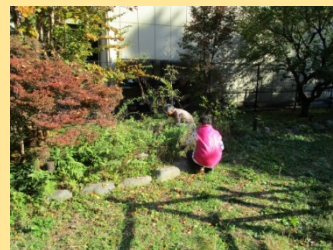
【ミントの間引きと刈込み】

間伐で出た竹を利用した樹名板に名前を入れました。1月頃、森の木の一部に名前が付きます。お楽しみに！