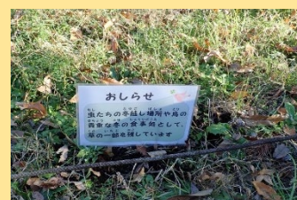
【原っぱ看板の取付け】

先月つくった竹の樹名板を森の樹木に取付けました。春に向けて草名板も取付けていきます。