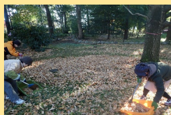
【コケゾーンの落ち葉布団】

多くの人にとって愛着のある森となるようにと、魅力アップに繋がる活動を行いました！