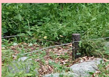
【ミントエリアの整備】

生垣のヒラギモクセイを剪定し、風通しを良くすることでハムシによる食害を減らす作業をしました。イキイキとした緑の葉っぱが出てきました。