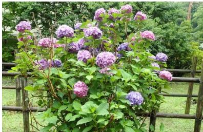
【アジサイがきれい！】