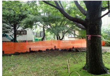
【フェンスの整備中】